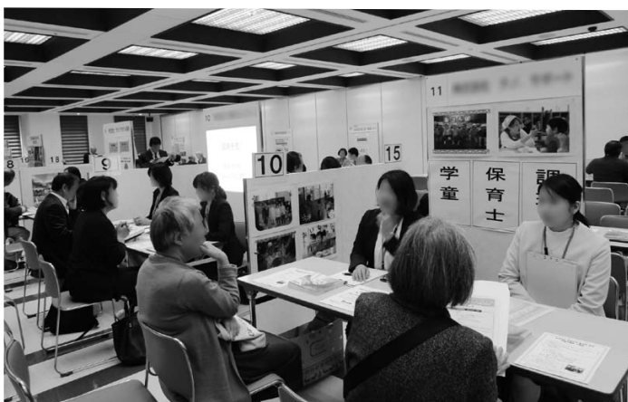
ブースでの企業説明実施風景 (H30)

当日、企業ブースでは求人応募・面接の申込みを受付けていません。 応募ご希望の方は、会場内の福岡県70歳現役応援センターの相談ブースにお越しください。 後日、福岡県70歳現役応援センターを通じて「あっせん登録、紹介」を行います。