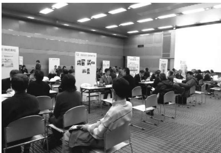
各企業の説明を聞く参加者 (H29)